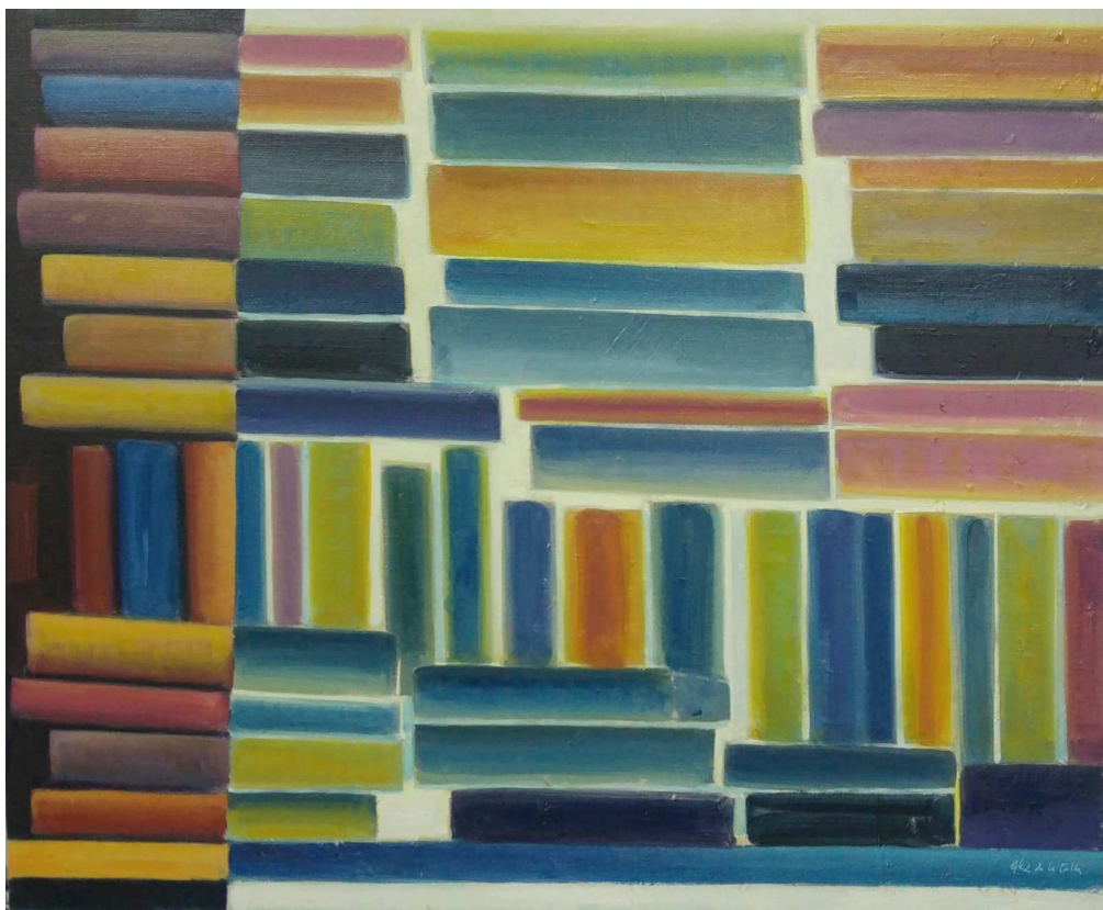
J.A. GLEZDELACALLE. Dos caras del libro 3 . 2018. Óleo sobre lienzo. 50 x 61 cm.

EXPOSICIÓN: DEL 28 DE MARZO AL 6 DE MAYO DE 2018