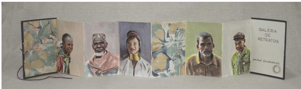
J.A. GLEZDELACALLE. Galería de retrato . 2013. Técnica mixta sobre papel. 19 x 92 cm.

En un texto de José Mateos del año 2004 y publicado con el título de “Un retrato dialogado de Juan Ángel González de la Calle”, el escritor hacía una acertada descripción del entorno del artista, y aludía al libro en su obra. Decía: “En su casa, un piso amplio, bien puesto, con ventanas que miran a un inmenso jardín algo descuidado, González de la Calle tiene una escasa representación de su obra en la casa. De todos modos, si levanto la vista puedo ver frente a mí algunos de sus oleos. Cuatro o cinco pinturas de tamaño y épocas diferentes, hechas con oficio y buen gusto, sin malabarismos, con cierto desconcierto estudiado, como esas mujeres que se despeinan un poco para arreglarse. Dan ganas de meterse en algunos de esos cuadros, seguro que en ellos encontraríamos la explicación que se callan. Verdes y rojos vibrantes, azules de un mar metafísico, naranjas y grises que se relajan hasta desmayarse. Y en ellos, niños en escorzo, sillas, animales... Y libros, libros bien encuadernados, libros antiguos, libros en desorden, libros encajonados, muchos libros”, y es que los libros han sido un elemento que ha utilizado el artista desde muy temprano. Han aparecido a veces como lo que son, y también como si fueran ladrillos o muros que formaban habitaciones y estructuras arquitectónicas.