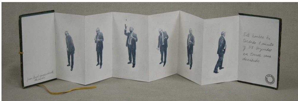
J.A. GLEZDELACALLE. Tomar una decisión . Técnica mixta sobre papel. 2013. 20 x 96 cm.

En un texto de José Mateos del año 2004 y publicado con el título de “Un retrato dialogado de Juan Ángel González de la Calle”, el escritor hacía una acertada descripción del entorno del artista, y aludía al libro en su obra. Decía: “En su casa, un piso amplio, bien puesto, con ventanas que miran a un inmenso jardín algo descuidado, González de la Calle tiene una escasa representación de su obra en la casa. De todos modos, si levanto la vista puedo ver frente a mí algunos de sus oleos. Cuatro o cinco pinturas de tamaño y épocas diferentes, hechas con oficio y buen gusto, sin malabarismos, con cierto desconcierto estudiado, como esas mujeres que se despeinan un poco para arreglarse. Dan ganas de meterse en algunos de esos cuadros, seguro que en ellos encontraríamos la explicación que se callan. Verdes y rojos vibrantes, azules de un mar metafísico, naranjas y grises que se relajan hasta desmayarse. Y en ellos, niños en escorzo, sillas, animales... Y libros, libros bien encuadernados, libros antiguos, libros en desorden, libros encajonados, muchos libros”, y es que los libros han sido un elemento que ha utilizado el artista desde muy temprano. Han aparecido a veces como lo que son, y también como si fueran ladrillos o muros que formaban habitaciones y estructuras arquitectónicas.