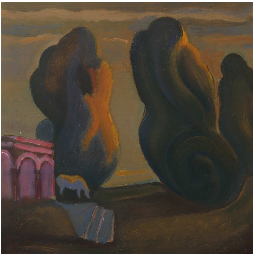
JOSÉ LUIS MAZARÍO. El pabellón . 2020. Óleo sobre tabla. 30 x 30 cm.